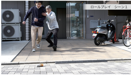
撮影協力 社会福祉法人ぷくぷく福祉会